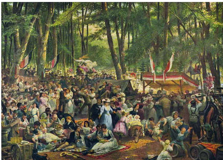
Wäldchestag um 1871 Gemälde J.H. Hasselhorst, Quelle Wikimedia.org, Historisches Museum Frankfurt

Für Kinder vom 6. bis einschl. 11. Lebensjahr bieten wir Schießen mit dem Lichtgewehr an.