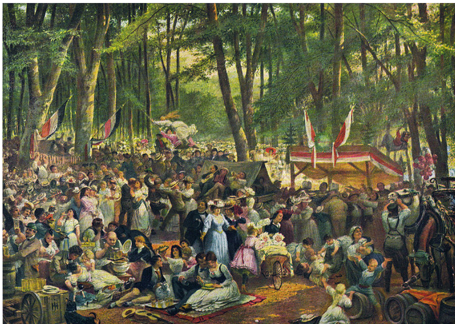
Wäldchestag um 1871 Gemälde J.H. Hasselhorst, Quelle Wikimedia.org, Historisches Museum Frankfurt

Jugendlichen ist das Schießen mit Luftdruckwaffen in Sportschützenvereinen gemäß des Waffengesetzes §27 (1) erst ab 12 Jahren erlaubt!!